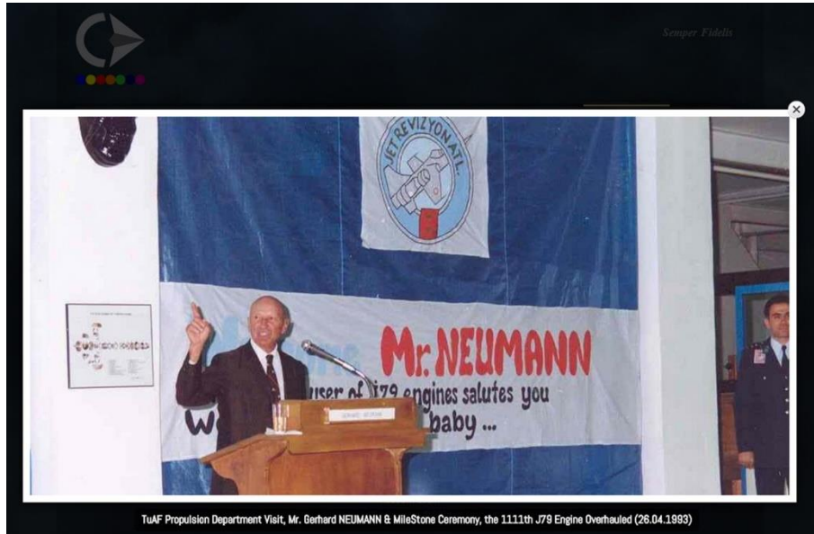
TuAF Propulsion Department Visit, Mr. Gerhard NEUMANN & MileStone Ceremony, the 1111th J79 Engine Overhauled (26.04.1993)

Gerhard NEUMANN, revizyon sonrası 22 Nisan 1993 günü servise verilen 1111'inci J79 motorunun "Faal Kart"ını da imzalayacaktı....