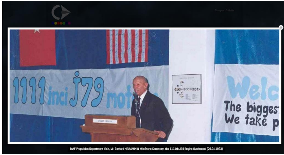
TuAF Propulsion Department Visit, Mr. Gerhard NEUMANN & MileStone Ceremony, the 1111th J79 Engine Overhauled (26.04.1993)