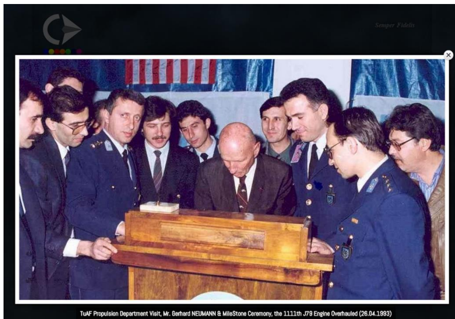
TuAF Propulsion Department Visit, Mr. Gerhard NEUMANN & MileStone Ceremony, the 1111th J79 Engine Overhauled (26.04.1993)

Gerhard NEUMANN, revizyon sonrası 22 Nisan 1993 günü servise verilen 1111'inci J79 motorunun "Faal Kart"ını da imzalayacaktı....