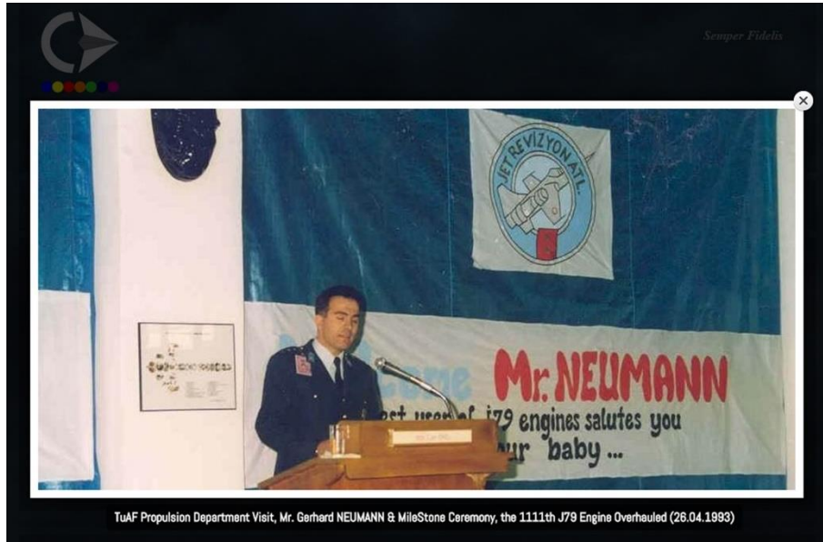
TuAF Propulsion Department Visit, Mr. Gerhard NEUMANN & MileStone Ceremony, the 1111th J79 Engine Overhauled (26.04.1983)