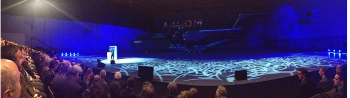
İlk A400M Uçağı Teslim Töreni

ve ortak çalışma ile bu fikre hayat kazandırmak zaten gerçek anlamda bir "İşbirliği Efsanesi" yaratmıyor mu?