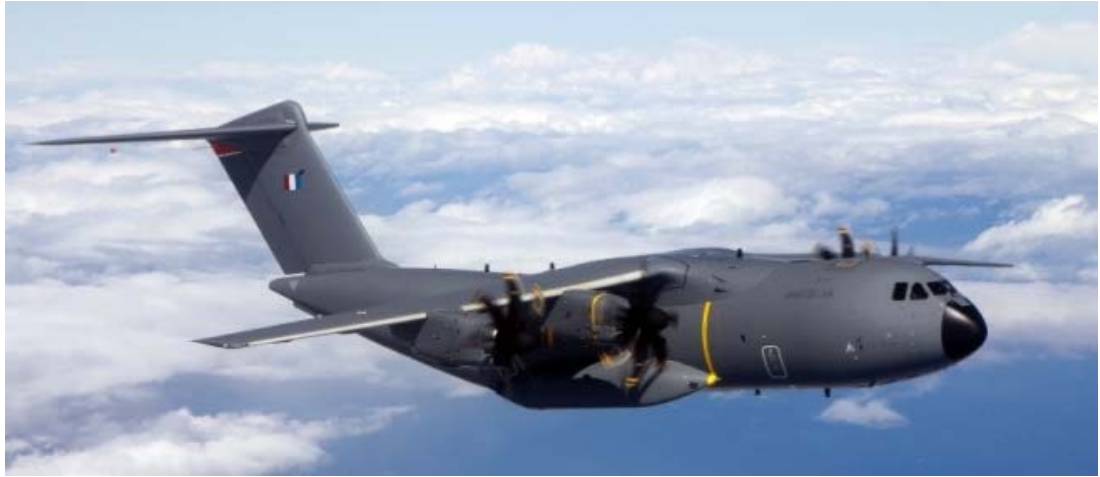
Fransa hava Kuvvetlerine Teslim Edilen MSN7 Numaralı A400M Uçağı

gibi heyecanlı bir faaliyet süreci olarak yaşanmaya devam etti.