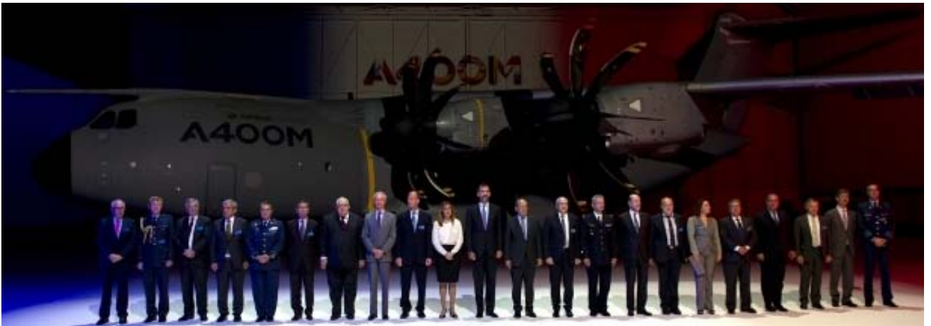
İlk A400M Uçağı Teslim Töreni