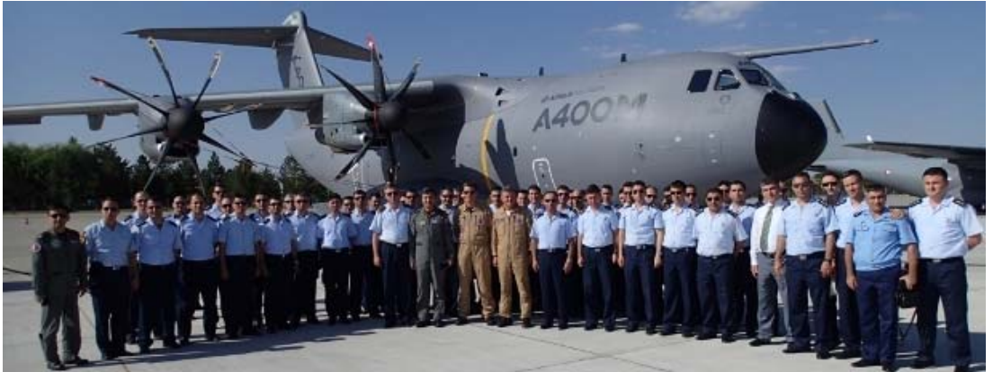
A400M Uçağı İlk Türkiye Ziyareti – Temmuz 2013